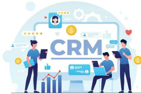
کیت باشگاه مشتریان نرم افزار حسابداری حسابان